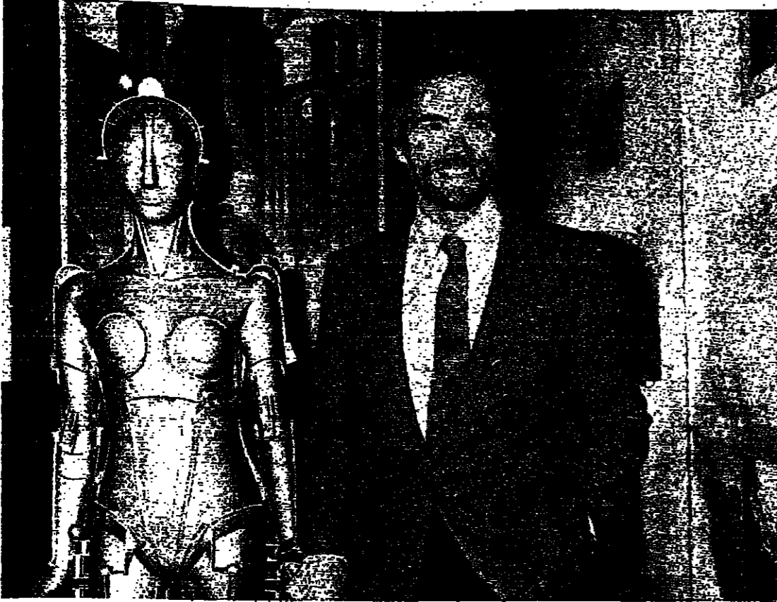
كليت استودو قرب مجسم لامرأة الفضاء